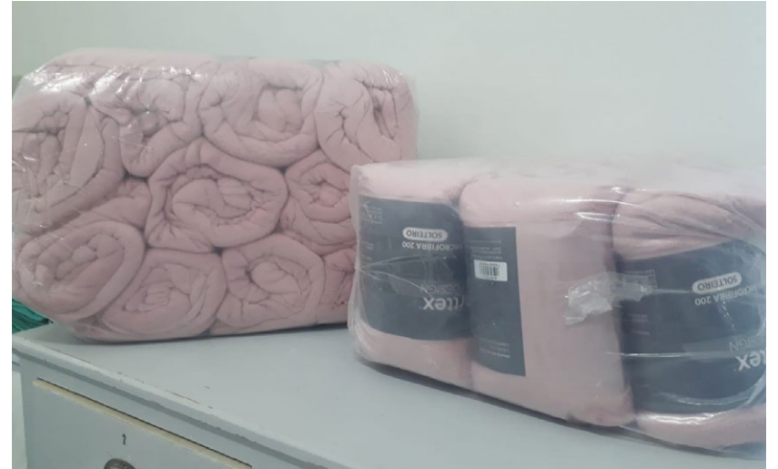
Cobertores doados por uma munícipe

A Santa Casa, por meio de sua Provedoria e Diretoria Administrativa, agradeceu os nobres gestos de todos que doaram, reafirmando seu compromisso de, muito além da excelência nos atendimentos, contribuir ao restabelecimento da saúde de seus pacientes, sendo essas doações sempre muito bem vindas e utilizadas pela Instituição.