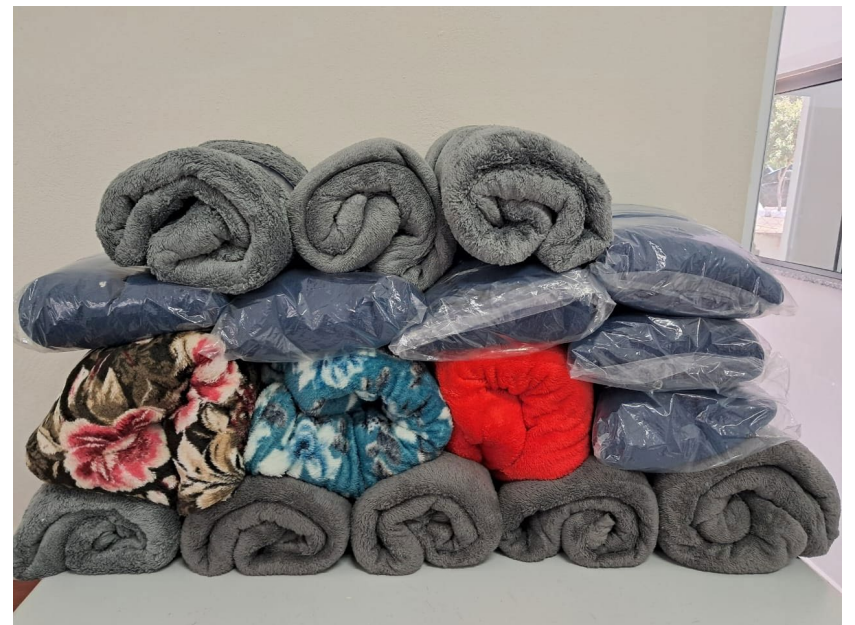
Cobertores doados pela Paróquia Santa Edwiges