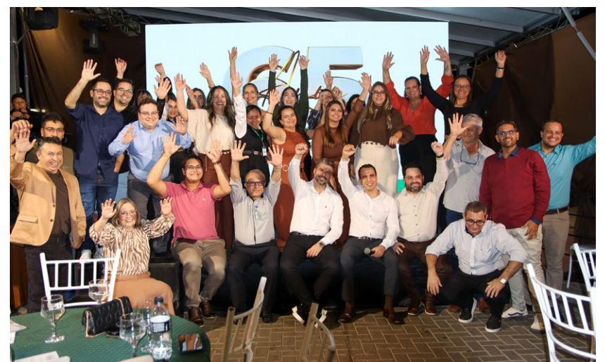
No registro, a diretoria da Rede Fonseca em momento marcante às comemorações dos 65 anos da empresa

E vem novidades por aí: a nova loja Fonseca será inaugurada em Cajuru no próximo mês, além de Vargem Grande do Sul, também prevista para este ano, contribuindo à consolidação da marca como a maior rede de supermercados da região.