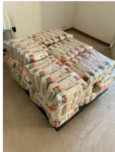
Doação dos 450 quilos de arroz arrecadados em aniversário solidário