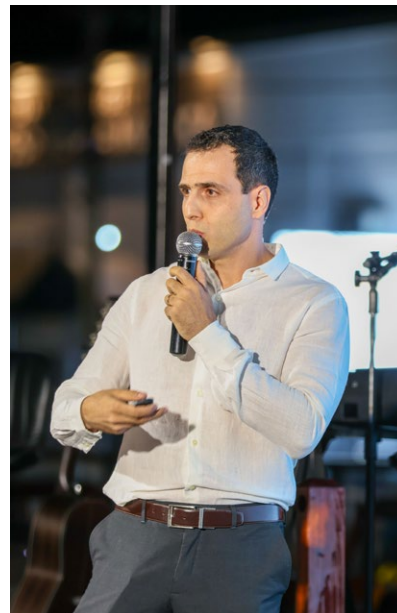
Dhiogo destacou a importância das parcerias que geram bons resultados, como as centenas firmadas à grande campanha

Como parte da campanha, também serão sorteadas duas casas, o sonho de muitos clientes, cuja premiação ocorrerá na segunda semana de janeiro de 2027.