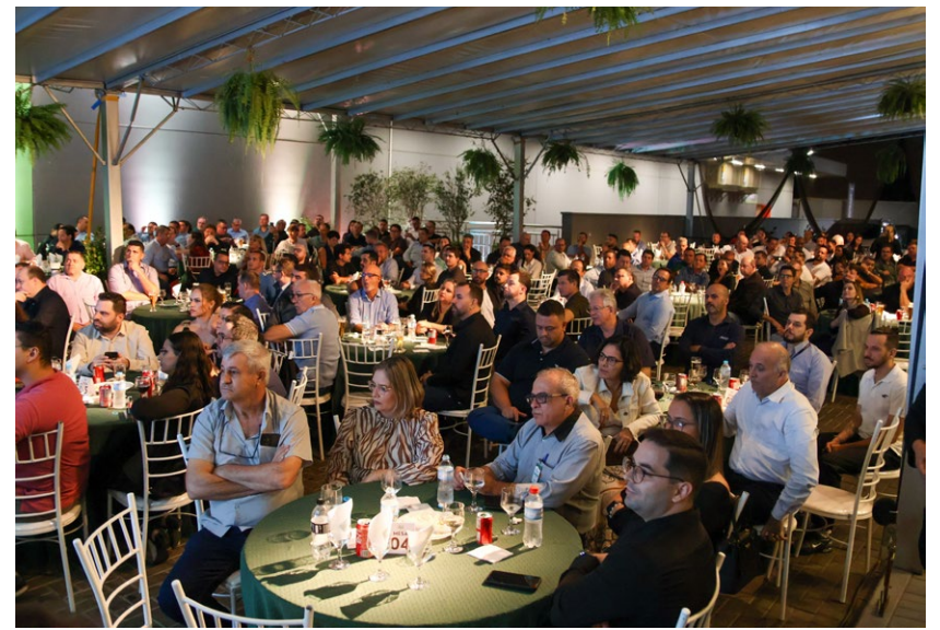
Evento de lançamento, realizado em Mococa, reuniu fornecedores e empresários