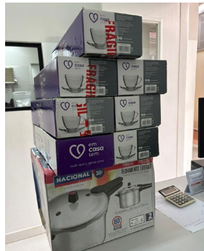
Utensílios doados e destinados ao SND