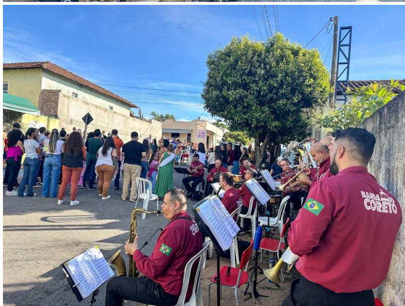
Difundir a cultura musical centenária da Corporação às novas gerações é um dos objetivos do ‘Música Educa’