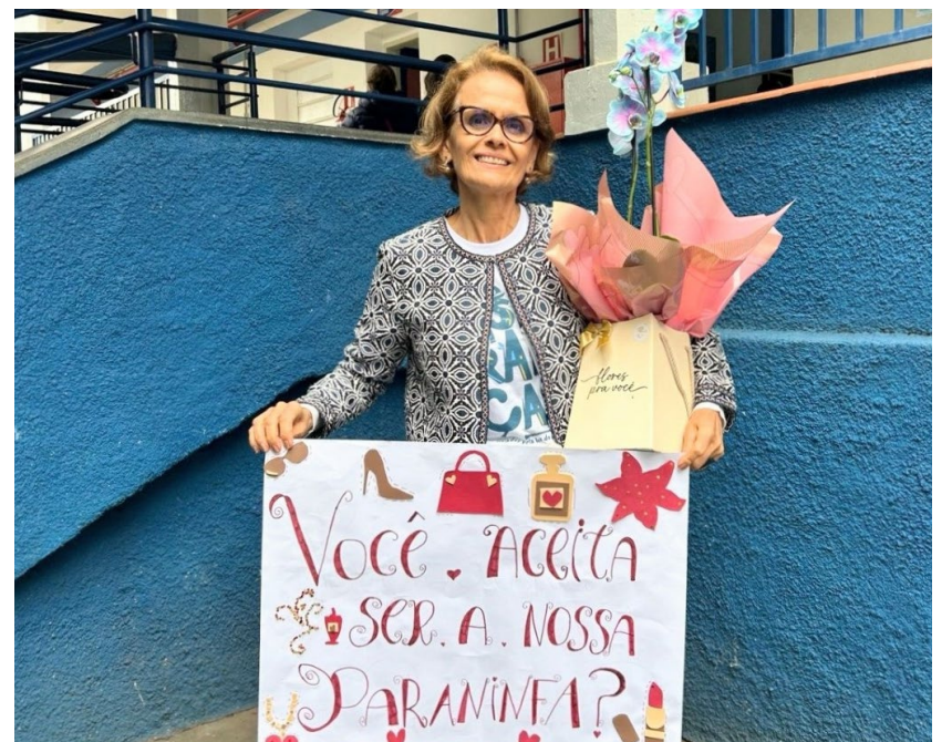
Emoção: Nestes longos anos dedicados ao Colégio, essa foi a primeira vez que a chamaram a ser paraninfa de uma turma formanda

Quem quiser conferir o emocionante convite, acesse o perfil da turma no Instagram https://www.instagram.com/9b_unigrau26/