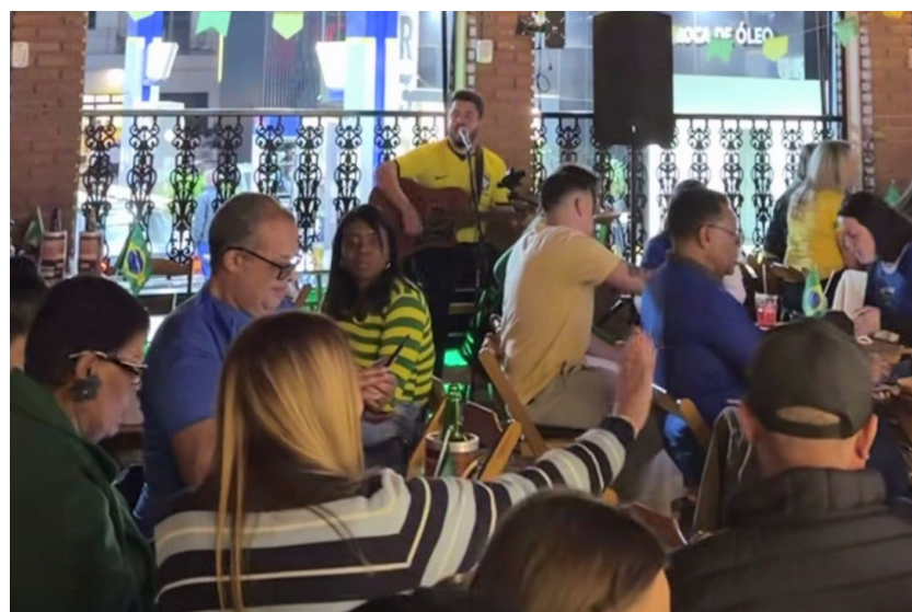
Trentin Chopp Bar também oferece música ao vivo em dias de jogos

as redes sociais, sendo a presença de ambos mais um diferencial do Trentin, recebendo a todos, mantendo contato direto com a clientela.