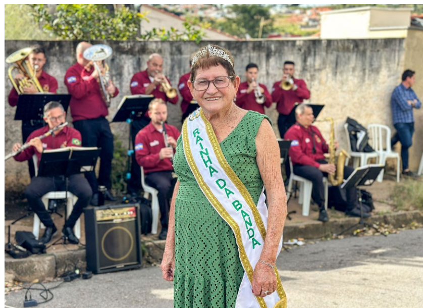
É claro que ela não pode faltar: a Rainha da Banda também esteve presente na apresentação na escola, como ocorrerá nas demais edições