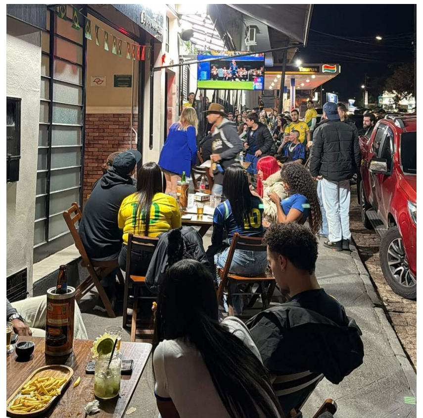
Registro do jogo do Brasil sexta-feira na parte externa do Bar Trentin