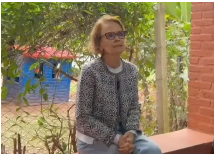
Professora foi surpreendida pelos alunos durante 'entrevista' no Colégio