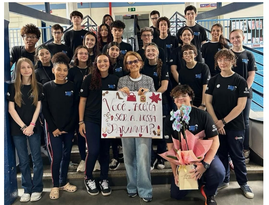
A paraninfa junto aos formandos: convite aceito e homenagem merecida à 'maestra'