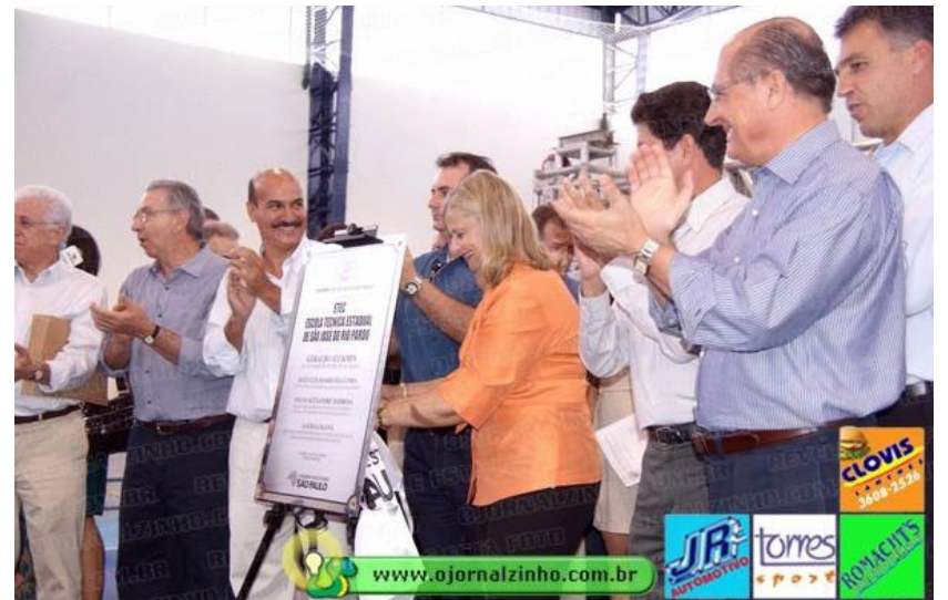
Inauguração do novo prédio que abriga a ETEC, em março de 2012, com a presença de autoridades locais e regionais

As mídias Minha São José parabenizam o essencial trabalho educacional e de formação técnica da ETEC em Rio Pardo, extensivo aos professores, coordenadores, equipes, alunos e comunidade. Que venham os próximos 20 anos! "O passado nos enche de orgulho, o presente nos inspira e o futuro nos motiva a continuar inovando e construindo oportunidades. Que esta história de excelência continue transformando vidas por muitas décadas", como também e assim desejou a Escola Técnica.