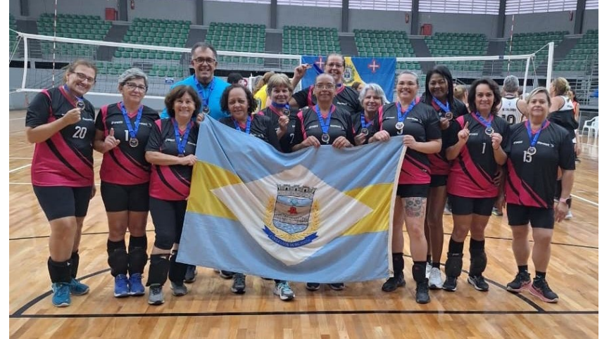
Participação e premiação da equipe no Festival de Vôlei Adaptado em Leme