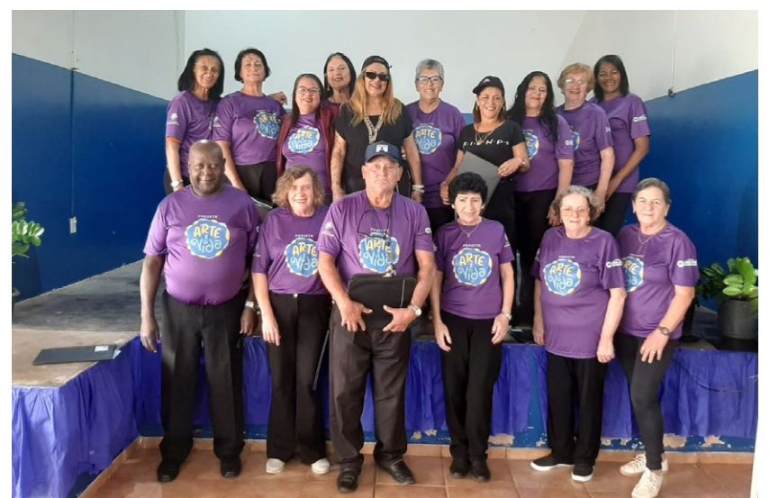
Participantes do Projeto Arte e Vida