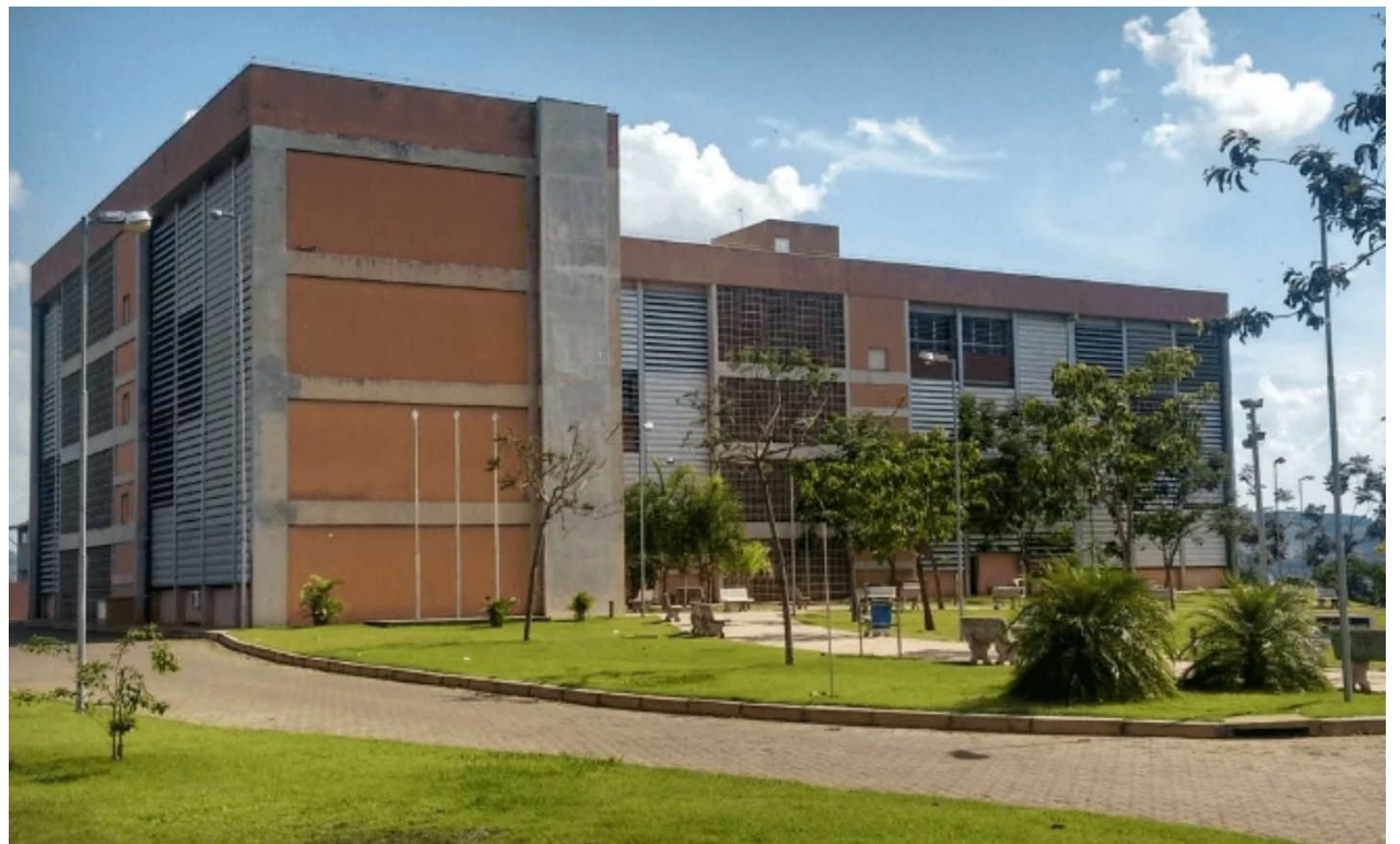
Escola Técnica oferece Ensino Médio e diversos cursos técnicos que, ao longo dessas duas décadas, vêm contribuindo à formação profissional de jovens de Rio Pardo e região

O nome da escola técnica não poderia ser outro - uma merecida homenagem a um dos