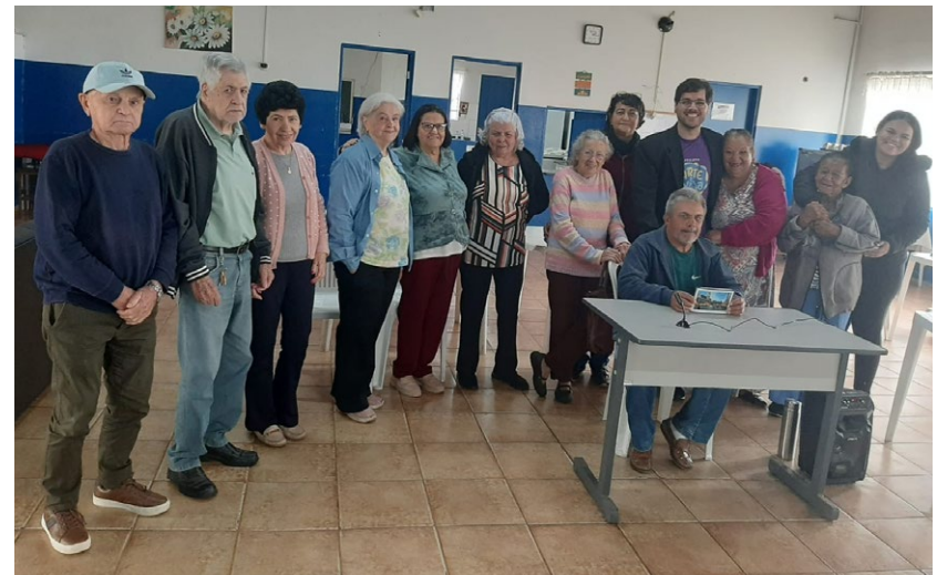
Idosos participantes dos Serviços de Convivência da Terceira Idade