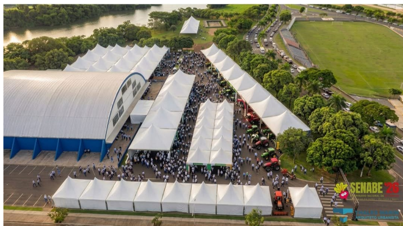
Evento agro será promovido, novamente, no espaço interno e externo do Ginásio Tartarugão

Texto: Natália Tiezzi.