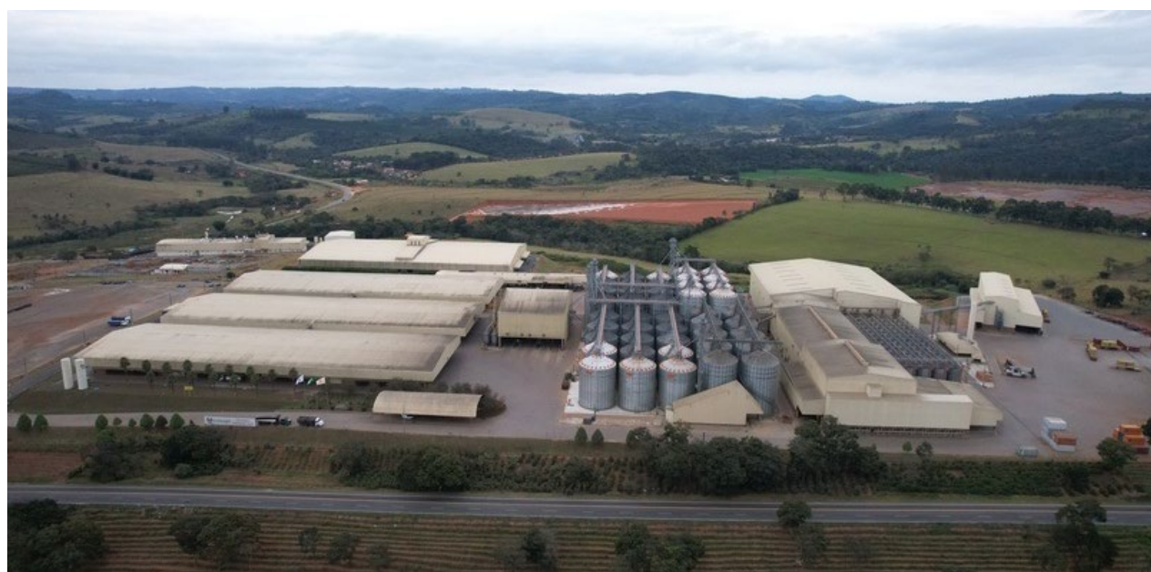
Ranking reconhece desempenho da Cooxupé em indicadores econômicos e destaca a relevância da cooperativa para o agronegócio estadual

O desempenho das cooperativas agropecuárias teve papel decisivo nos resultados do cooperativismo mineiro em 2025. O segmento movimentou R$ 66,8 bilhões