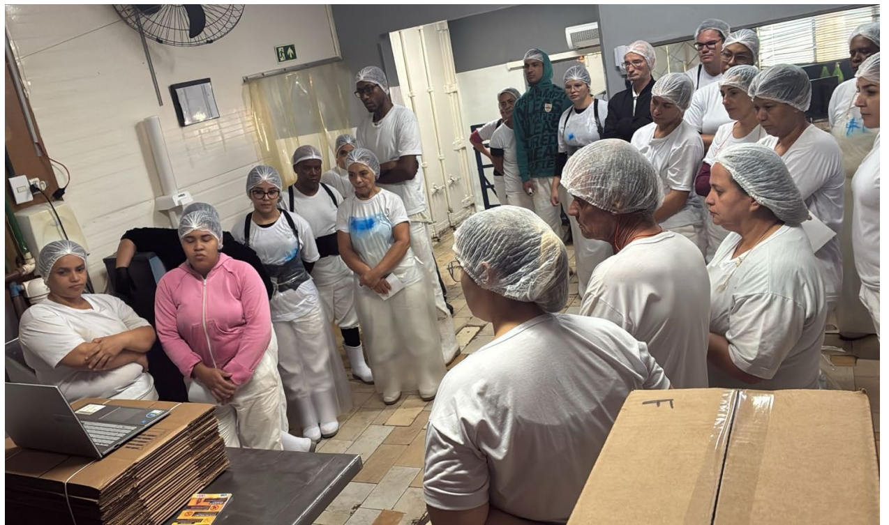
Ação expôs, debateu e esclareceu dúvidas sobre principais causas de acidentes, situações cotidianas ao volante, além de cuidados e postura ao dirigir

presário, gostaria de conhecer e oferecer o Programa Saúde Assistencial e Ocupacional SAVISA à sua empresa e colaboradores? Entre em contato pelo 3608-2000 para mais informações.