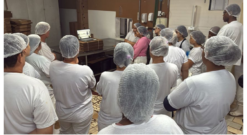
Video educativo sobre direção defensiva foi direcionado a todos os colaboradores da empresa

“Os empresários estão tendo um respaldo maior sobre as demandas de saúde de seus colaboradores, também