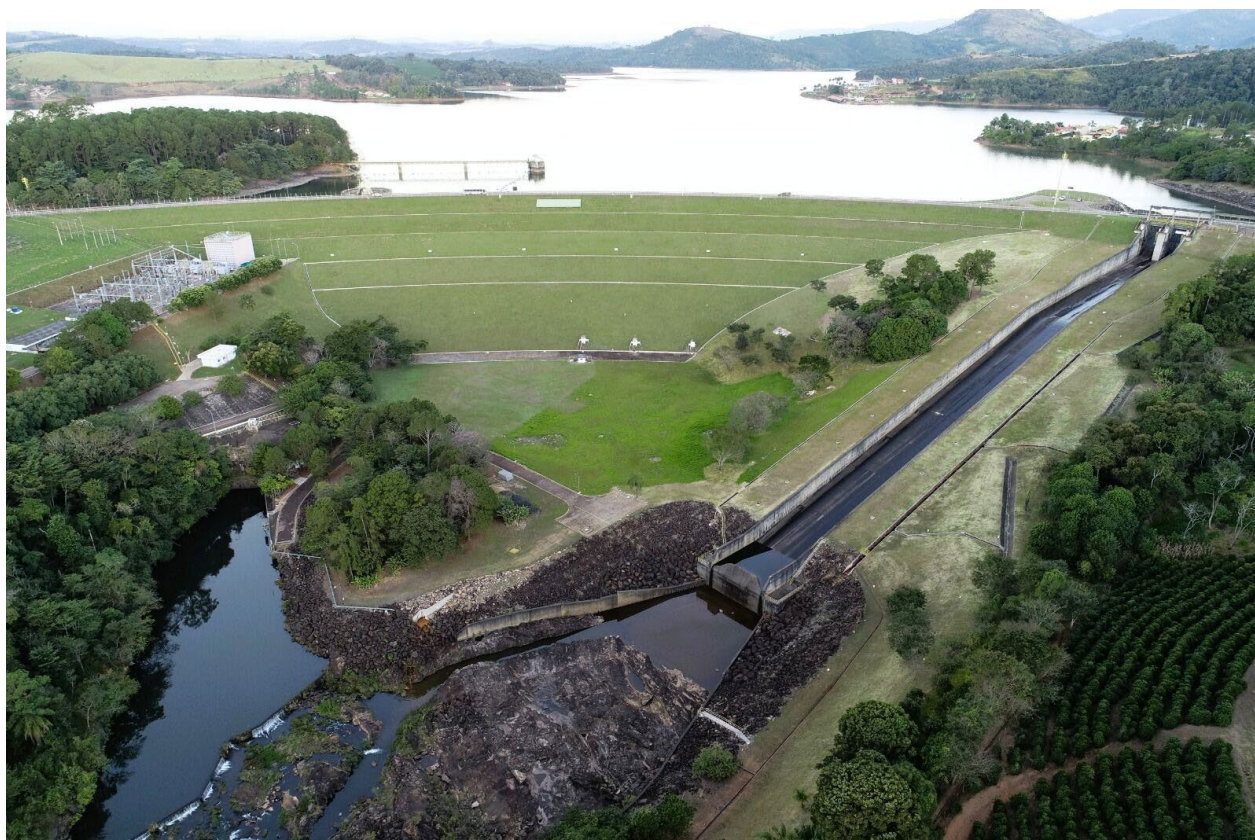
Na região das hidrelétricas de Caconde (foto), Euclides da Cunha e Limoeiro, as propostas devem contemplar as regiões do entorno, que compreendem cidades como Caconde, Mococa e São José do Rio Pardo

Com informações e foto da Infomuts Comunicação à imprensa.