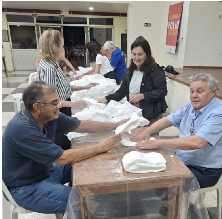
Produção acontece semanalmente na sede da entidade, reunindo os rotarianos

Mais do que produzir fraldas, os companheiros vivenciam momentos de união, fraternidade, dando de si antes de pensar em si, sendo este um dos lemas do Rotary, por meio deste essencial Projeto, que muito beneficia entidades e pessoas no município.