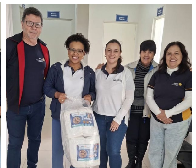
Unidade de Oncologia recebendo as doações