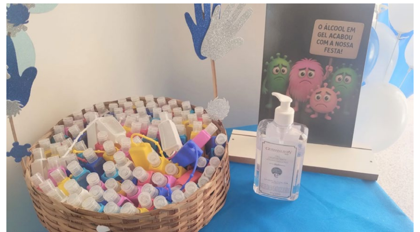
Acesso à entrada dos colaboradores recebeu cartazes com orientações que reforçam a importância da higiene das mãos