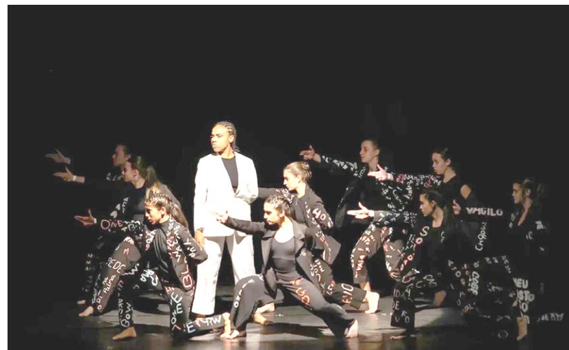
Coreografia “Sobreviver”, de Café, selecionada para representar o Brasil em festival internacional