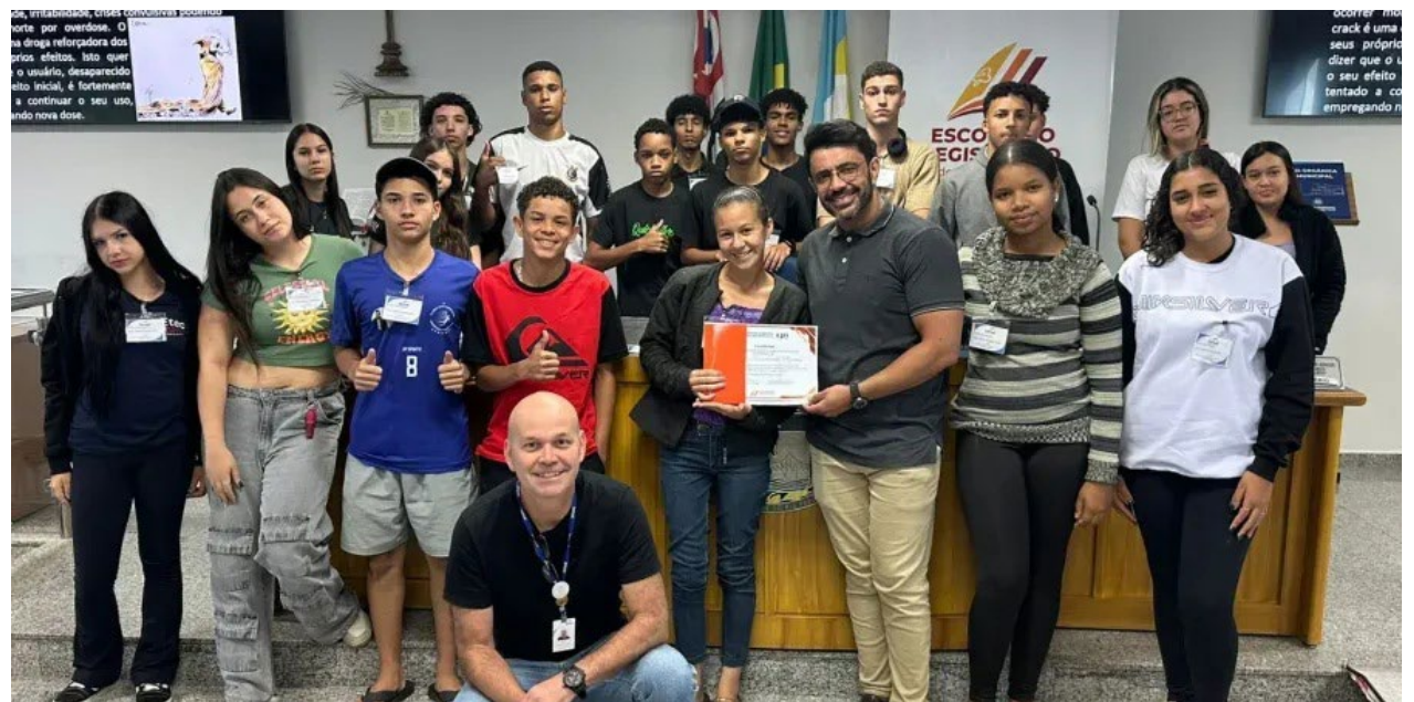
O ex-vereador junto aos alunos do Senac: abordagem necessária para os jovens