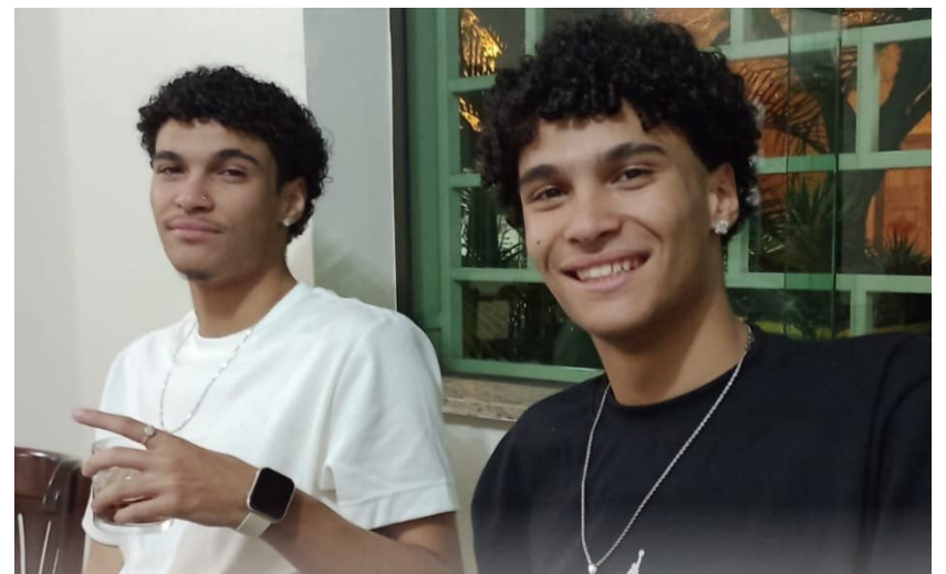
Memória afetiva do Sincomerciários: Nas fotos acima, divulgadas pelo Sindicato, os gêmeos recém nascidos, que receberam o primeiro Kit Baby, e agora, ao completarem 18 anos

além da defesa de direitos trabalhistas. O verdadeiro papel da entidade também está presente no cuidado com as famílias, no apoio social e na valorização da dignidade humana”.