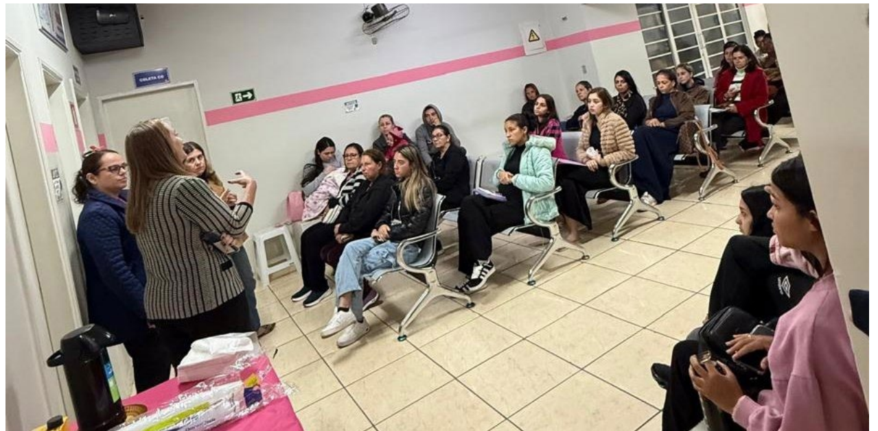
Ação promovida pelo Poder Público junto à Universidade levou mais conhecimento, esclarecimento de dúvidas e orientações às mulheres

que contribuem para a conscientização, o acolhimento e a promoção da saúde das mulheres de São José do Rio Pardo. Ela funciona na Secretaria Municipal de Assistência e Inclusão Social, já que é anexa à Pasta, onde o público feminino e a população em geral pode visitar, receber orientações sobre diversos assuntos relacionados à mulher e esclarecer dúvidas.