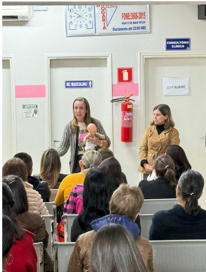
Situação por vezes comum para quem tem bebês é o engasgo, cujas práticas práticas sobre primeiros socorros também foram evidenciadas