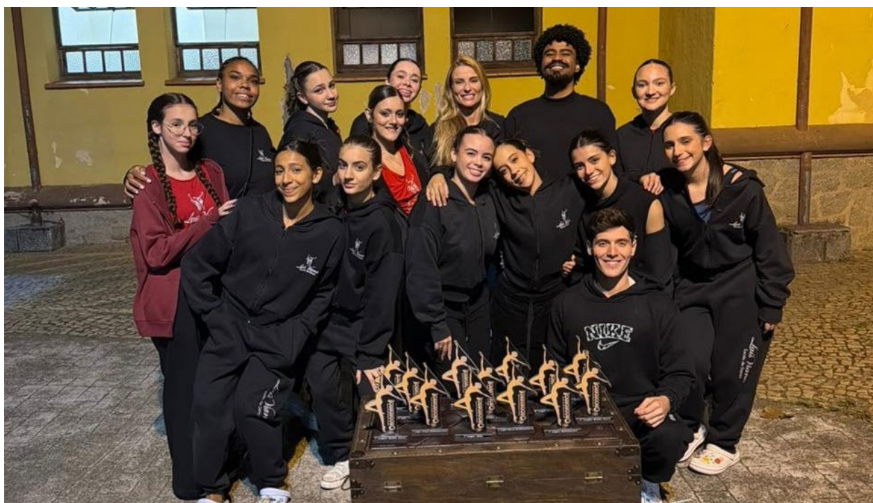
Bailarinos e bailarinas que se apresentaram no Festival Internacional, que ocorreu em Poços de Caldas, com os troféus conquistados

Ela agradeceu a todos os alunos, bailarinos, coreógrafos e equipe pelo empenho, dedicação e excelente desempenho. “Agradeço, ainda, aos pais pela confiança e parceria de