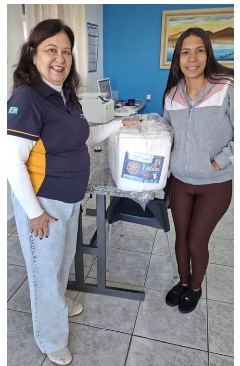
Entrega de fraldas no Asilo Lar de Jesus