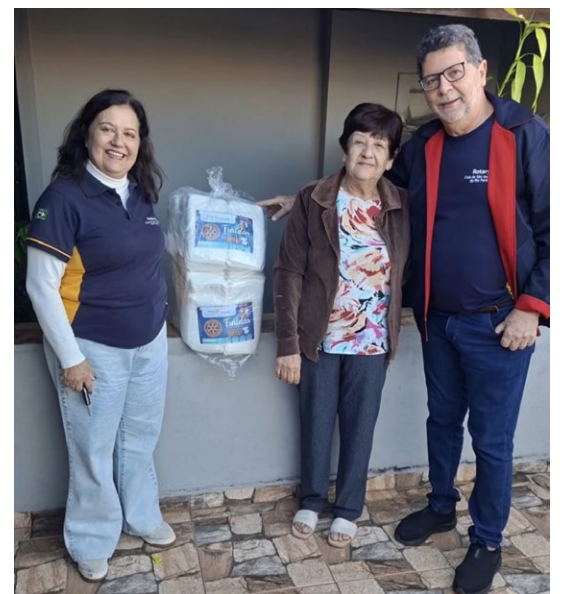
Uma das municipais, de comunidade de bairro, recebendo as fraldas