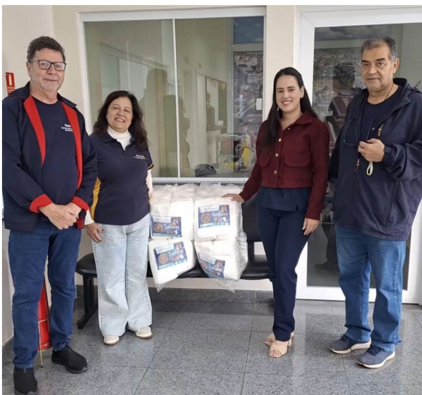
Entrega das fraldas realizadas à Santa Casa Hospital São Vicente