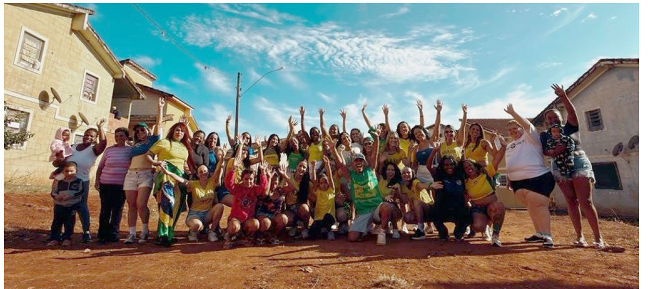
O grupo reunido no Profast, junto a alguns moradores, em dia de gravação especial

"Foi uma forma de mostrar as muitas faces dessa comunidade que, como inúmeras Brasil afora, necessitam de um olhar dos Poderes Públicos mais direcionado a elas, mostrando, ainda, a garra, a vontade, as experiências e as vi-