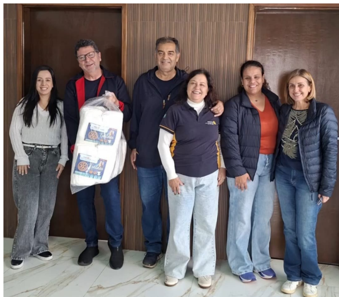
Doação sendo entregue ao CREAS/Assistência Social