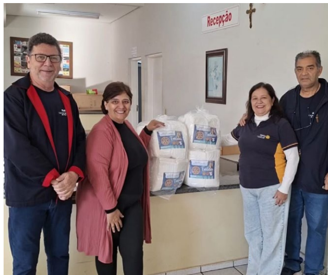
Doação sendo entregue na Secretaria Municipal da Saúde