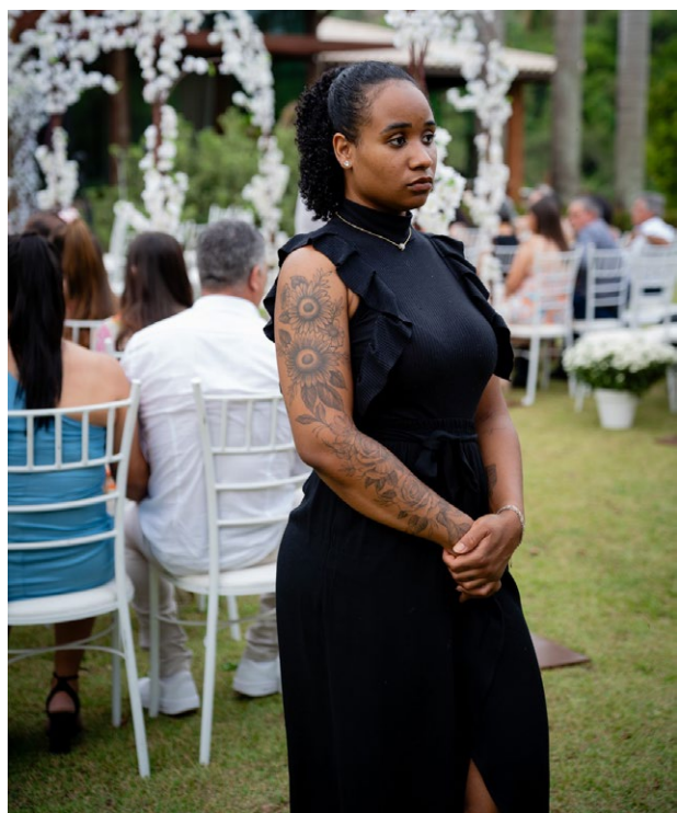
Disciplinada, atenta, dedicada: características sempre elogiadas por clientes que a fizeram investir no negócio próprio