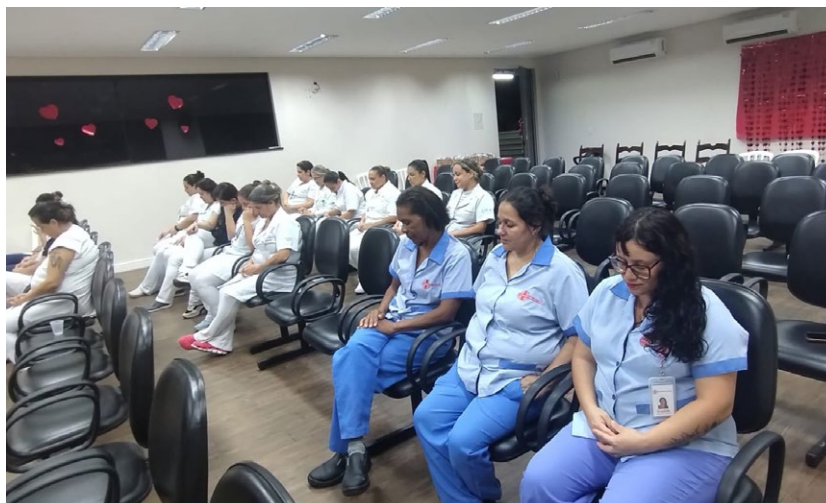
Ambos registros são das homenagens promovidas quinta-feira, 07/05 (períodos da manhã e noite)