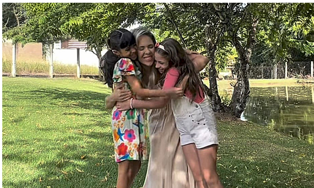
"Sobre minhas filhas como mães, eu gostaria que elas fossem mulheres que respeitassem quem são, sem se anularem no caminho. Que entendessem a importância de cuidar de si mesmas também, porque quando a mãe está bem, isso se reflete diretamente nos filhos e na forma como eles crescem e se sentem dentro da família", concluiu

Neste Dia das Mães, eu gostaria de lembrar cada mãe que ela não precisa dar conta de tudo sozinha. Que por trás de toda mãe existe também uma mulher que sente, que se cansa e que muitas vezes se cobra demais. E que cuidar de si mesma não é egoísmo. Quando a mãe olha para a própria história, se fortalece e se cuida, isso também se reflete nos filhos. Que todas as mães possam viver uma maternidade com mais leveza e menos sobrecarga. E, acima de tudo, que elas se lembrem de que são as mães certas para os filhos que têm, porque se não fossem elas, não seriam esses filhos.