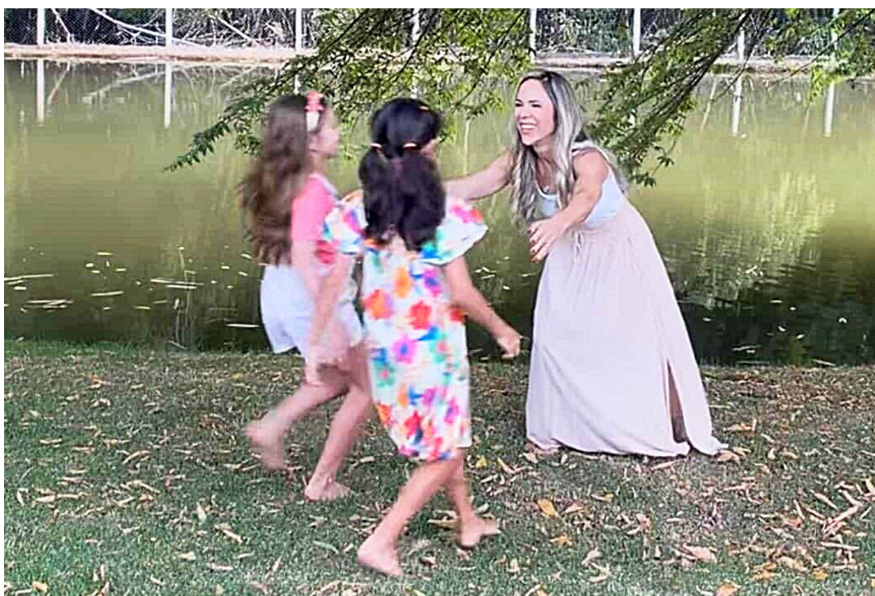
"Mas a maternidade real é muito diferente da maternidade idealizada. Ela é linda, transformadora, mas também nos convida a amadurecer, olhar para nós mesmas e aprender um pouquinho todos os dias", observou

Para mim, ser uma boa mãe não é acertar o tempo todo. É amar, cuidar, reparar quando for necessário e entender que os filhos não preci-