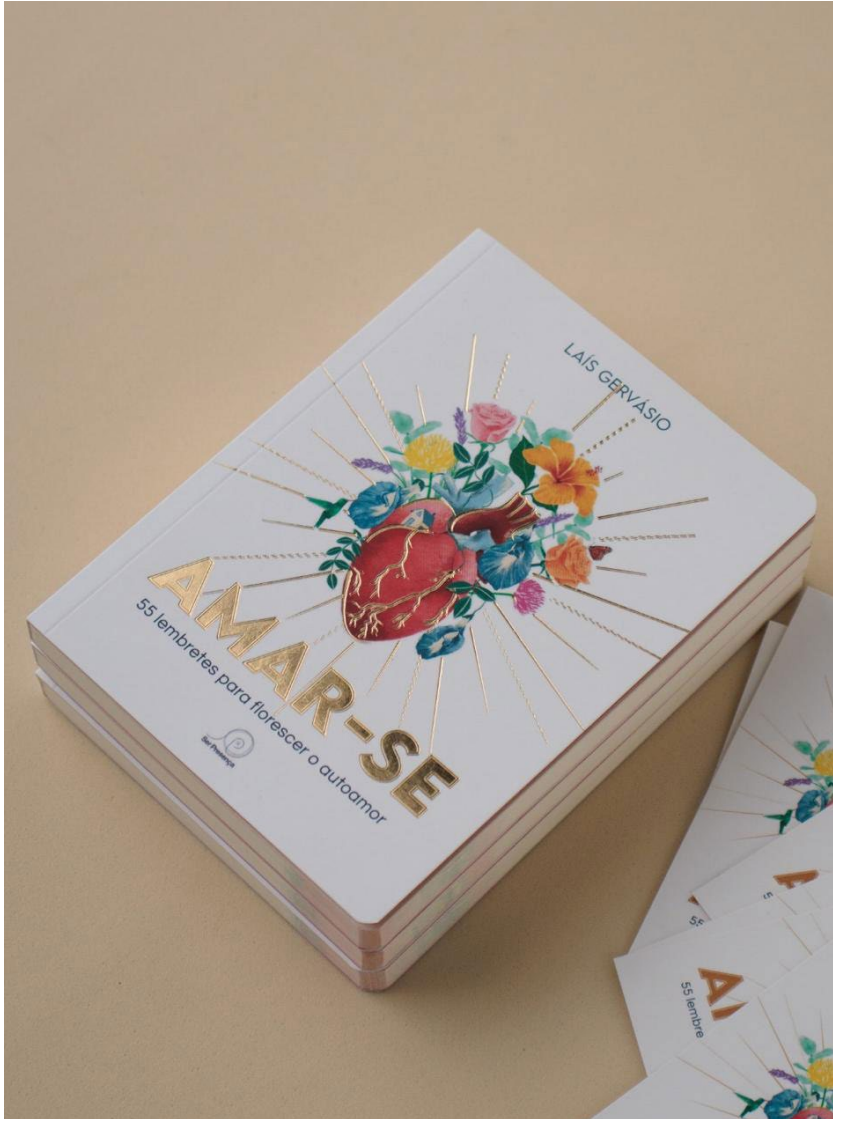
Em 55 lembretes, obra propõe uma reflexão prática sobre autoestima e responsabilidade emocional feminina

Ficam os convites à leitura do livro oráculo e também a participação ao Retiro - momentos para todas florescerem o autoamor, a autoestima e a responsabilidade emocional feminina.