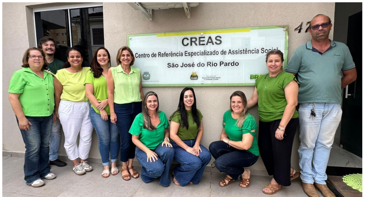
A equipe do CREAS, especializada em acolhimento, escuta qualificada e acompanhamento psicossocial a famílias e indivíduos em situação de risco social ou com direitos violados