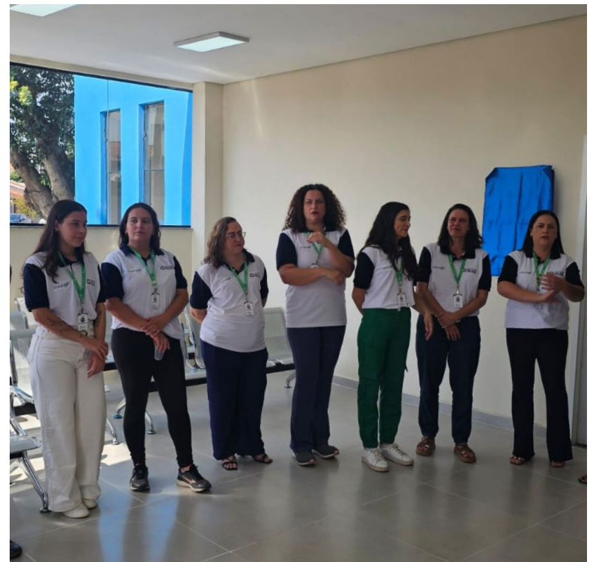
Parte da equipe que fará parte do Recanto Girassol: profissionais especializadas ao acolhimento, acompanhamento e desenvolvimento das pessoas com TEA e seus familiares

atendimentos, encaminhamentos, etc, que informou que essas orientações serão repassadas nos próximos dias pela Secretaria Municipal de Saúde, entretanto às pessoas que quiserem tirar dúvidas sobre como funcionará o Recanto Girassol poderão se dirigir ao novo espaço, frisando que já está em funcionamento.