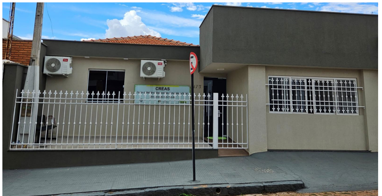
O novo espaço do CREAS, à rua Benjamin Constant, 473, Centro