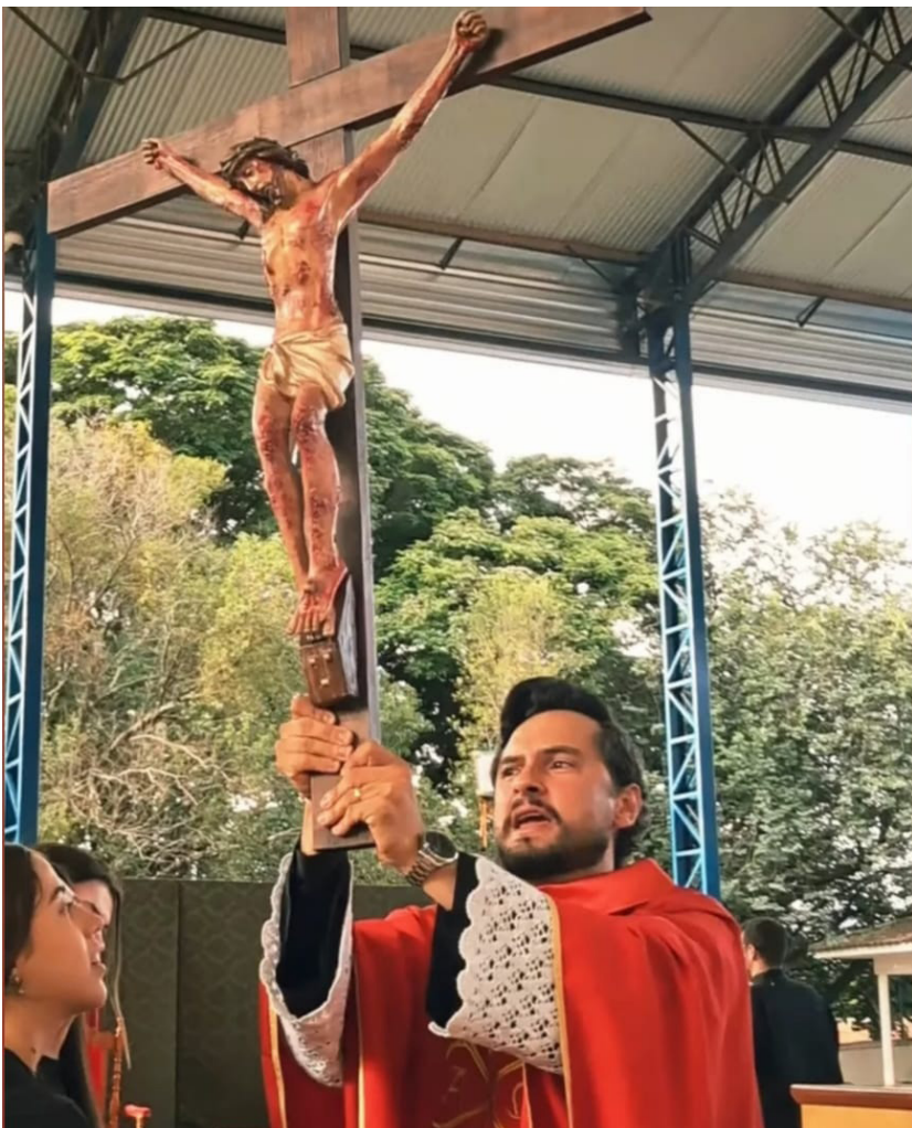
"O grande aprendizado que a Páscoa nos deixa para o resto do ano é este: viver como ressuscitados. Isso significa cultivar esperança mesmo nas dificuldades, acreditar na transformação, escolher o bem mesmo quando é mais difícil"

Para nós, a Páscoa representa recomeço. É a certeza de que nunca estamos presos definitivamente ao erro, ao pecado ou à dor. Sempre há um caminho novo, sempre há ressurreição possível.