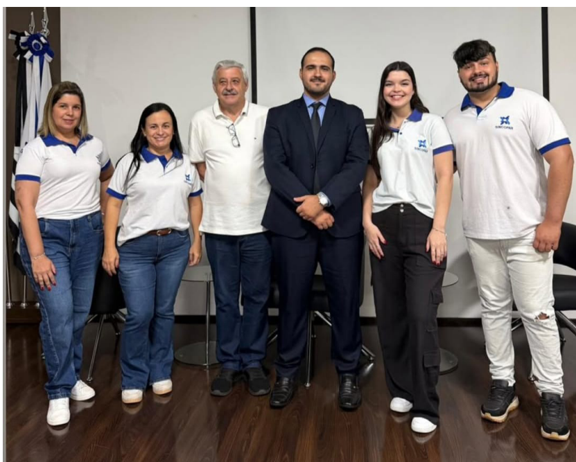
A equipe do Sincopar junto a Izonel e ao palestrante convidado durante recepção no auditório do Sindicato