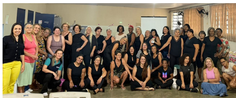
Ações às mulheres que frequentam o CRAS Vale Redentor