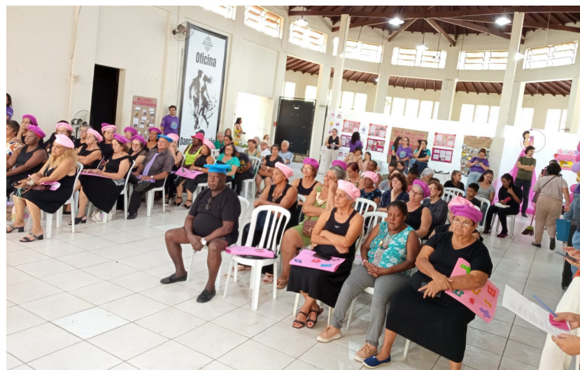
Dezenas de mulheres reunidas nas ações promovidas no Mercado Cultural

Mais do que reunir as mulheres em diferentes pontos do município para difundir informação e promover a sociabilização, as ações foram formas simples de o Poder Público reconhecer e enaltecer o importante papel feminino perante à sociedade, seja na mulher dona de casa, seja na profissional, nas mães ou naquelas que já passaram dos 60+ e são grandes exemplos de coragem, determinação e vitalidade perante à população.