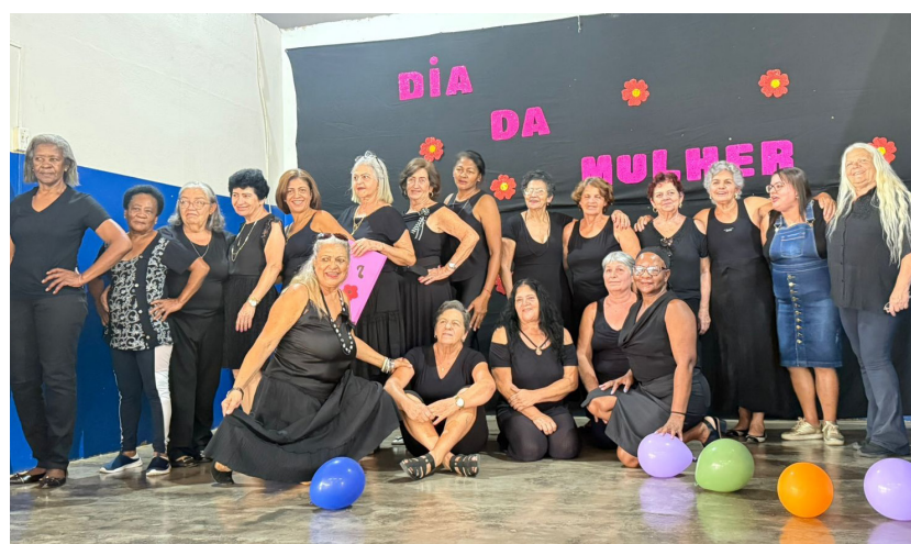
Neste registro, atividades no Centro de Convivência da Terceira Idade