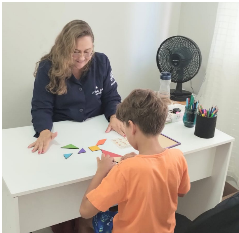
A neuropsicopedagoga observou, ainda, a importância do ambiente clínico ao desenvolvimento das terapias, especialmente a ABA, ao desenvolvimento do paciente

“Toda essa preocupação, não apenas no ambiente da clínica ou espaço onde passará por terapias, junto ao ambiente caseiro e escolar fazem parte do contexto em que a criança convive diariamente e pode interferir, de maneira positiva ou negativa, em seu desenvol-