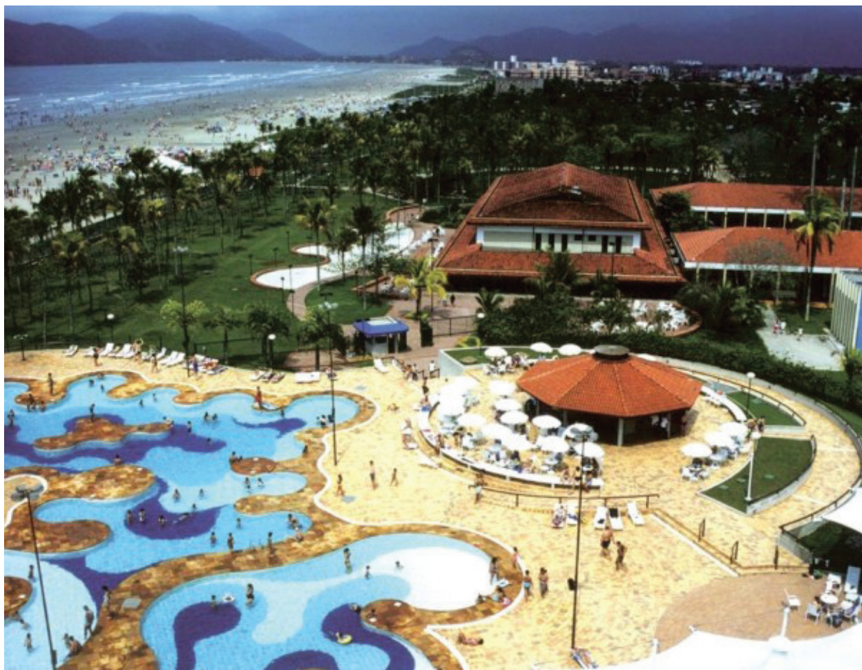
Vista parcial do Sesc Bertiooga: espaço de lazer, entretenimento e diversão, com 995 mil metros de área verde preservada

"Para mim, em especial, é uma satisfação contribuir para proporcionar esses passeios aos comerciários. A união de muitos empresários resultou na conquista de um Sesc, com um funcionamento perfeito, de primeiro mundo para levar essas vantagens aos nossos trabalhadores. Investir no lazer do trabalhador é também investir em motivação, saúde e qualidade de vida, fortalecendo toda a cadeia do comércio regional", concluiu Izonel.