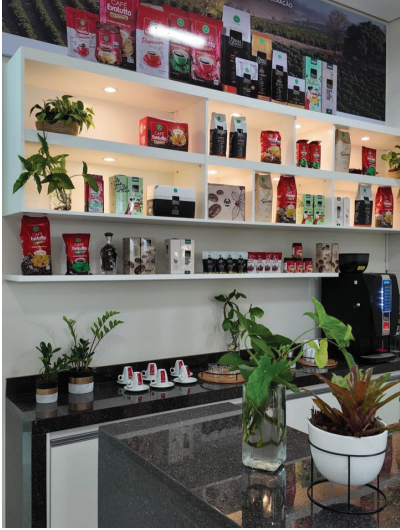
Em novo endereço, mas com muita história - Departamento de Consumo da Cooperativa tem mais de 70 anos de atividades

Em nota oficial divulgada quarta-feira, 21/01, a Prefeitura, por meio da Secretaria Municipal da Educação informou que a Creche Júlio Possebon, localizada na Vila Maschietto, será revitalizada.