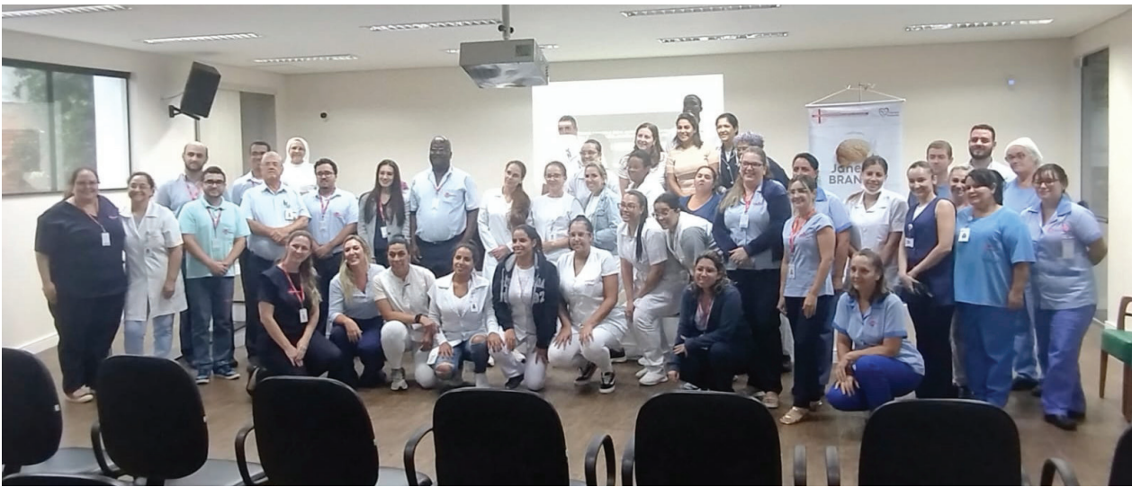
Palestras aconteceram no Auditório do hospital e reuniram dezenas de colaboradores, de todos os setores

“Terapia não é para vocês terem mais qua-