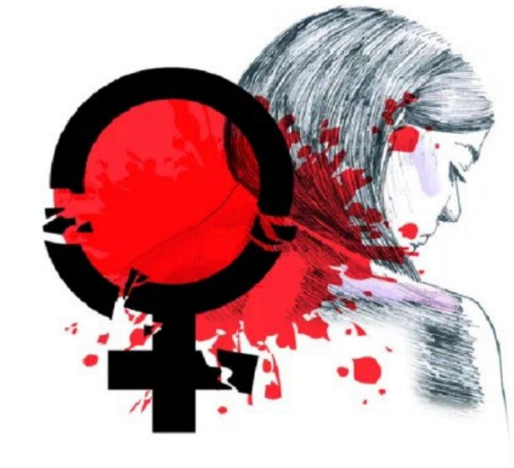
As principais causas do Feminicídio são a cultura machista, a impunidade ou demora judicial e a dependência emocional e financeira, que, por vezes, dificulta a saída da vítima do ciclo de violência

Outras dicas importantes: - Identificar si-