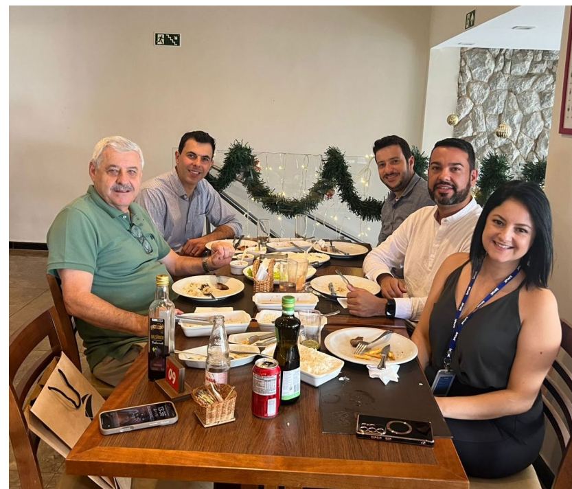
Izonel e representantes do SENAC e da Rioplastic em um dos encontros à promoção de projeto para qualificação profissional

“Esse é um projeto inovador da Rioplastic, que já conta com o apoio do Sincopar, pois