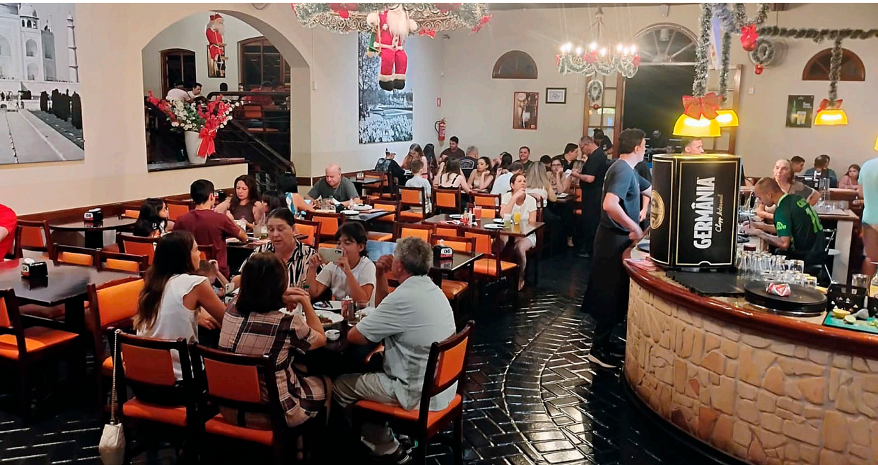
Final de ano é sempre sinônimo de casa cheia, principalmente pelas famílias, amigos e confraternizações

anos. Além disso, estamos sempre atentos às inovações, melhorando a estrutura da casa em todos os setores. E se tivermos uma oportunidade, expandir para outros espaços, municípios. Porém, isso é algo que precisa ser muito bem planejado, talvez com uma outra sociedade, para que se tenha realmente êxito e não atrapalhe o que já está consolidado.