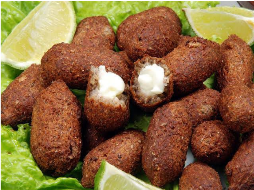
As esfihas abertas e os quibes recheados são os pratos mais pedidos do vasto cardápio do restaurante