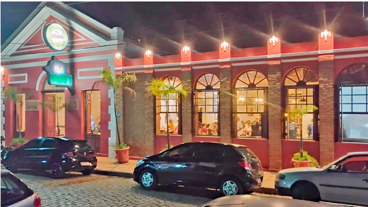
O Raribb's fica à rua José Andreoli, 31, Centro, e funciona de terça a domingo, a partir das 18h30